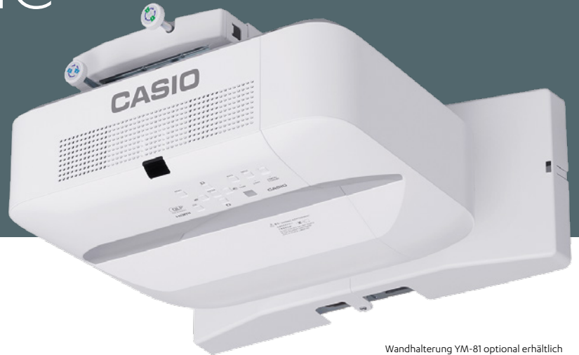
Wandhalterung YM-81 optional erhältlich