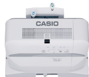
Wandhalterung YM-81 optional erhältlich